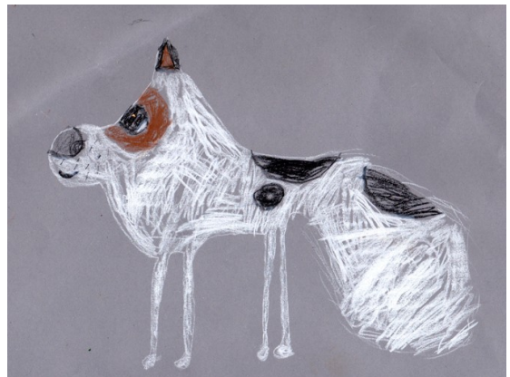
IIRIS SIMOLAN, 9 v, PIIRTÄMÄ KOIRA NÄYTTÄÄ NIIN LEMPEÄLTÄ, ETTÄ SITÄ TUSKIN TARVITSISI PELÄTÄ.

Tässä muutama neuvo, jos huomaat vieraan koiran lähestyvän sinua uhkaavasti. Pysy paikoillasi, älä nosta käsiäsi ylös, älä katso koiraan silmiin, pidä suusi tiukasti kiinni. Jos koira näkee hampaasi se luulee sinun uhkaavan itseään.