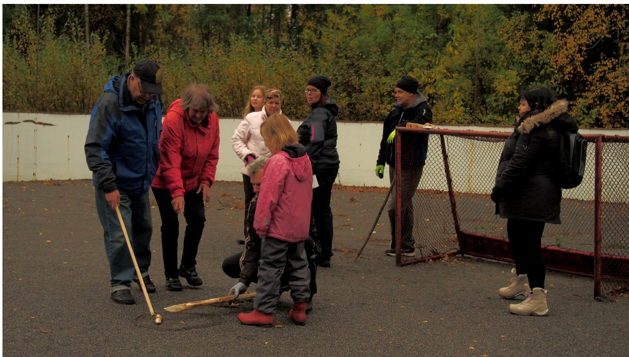
LEHTI-ILMOITUKSEN PERUSTEELLA PELITAPAHTUMAAN TULI MUUTAMA INNOKAS KYLÄN ULKOPUOLELTAKIN

Ennen pelillisiä aktiviteetteja osallistujien käytettävissä oli maksuton pilppupaja, jossa jokainen halukas pystyi tekemään itselleen oman pelipalikan. Ja kun kylmä alkoi kangistaa tai teki mieli huilata hetki, niin pääsi virkistäytymään pullakahveilla ja lämpimällä mehulla.