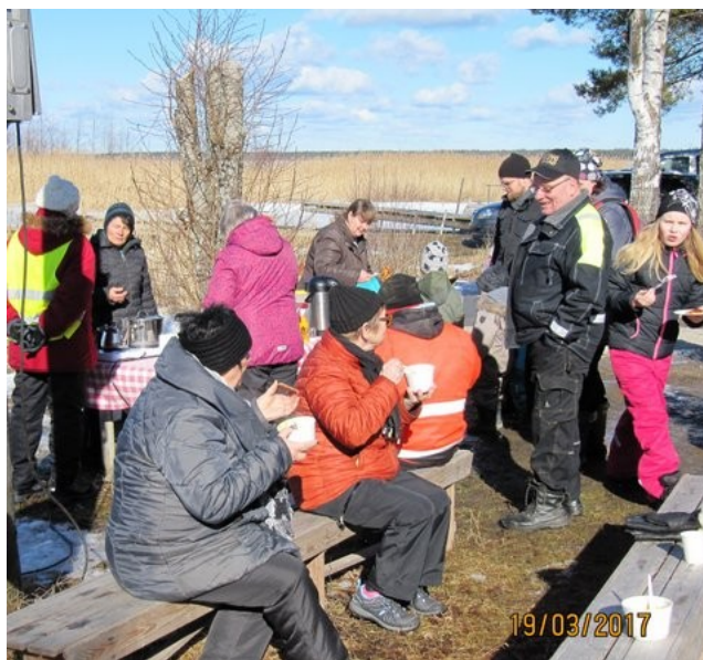
VÄKEÄ KALARANNASSA NAUTTIMASSA KUUMASTA HERNEKEITOSTA, KAHVISTA JA PANNARISTA

Siinä on nyt suurin piirtein isoimmat menoerät tältä vuodelta. Lisäksi tulee kaikkia vähäisiä kuluja kuten mustekasetteja tulostimeen ym.