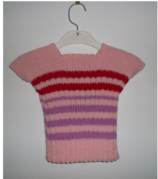
BIRGITAN KUTOMA NUTTU n:o 410

Nutut voi toimittaa Anneli Koskiselle, 044 294 0415